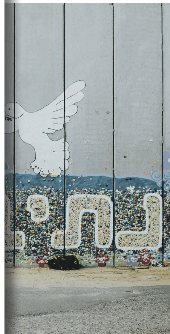
den ist noch weit.

palästinensischen Liturgie ist ilen – so lautet die Devise.