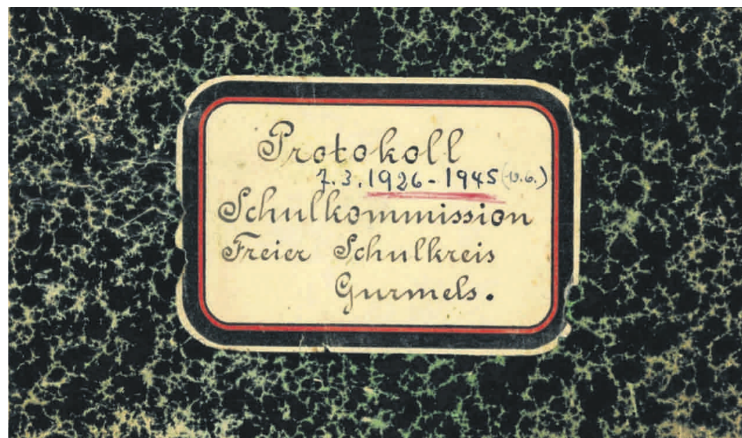
Über die Sitzungen der Schulkommission wurde feinsäuberlich Protokoll geführt. Etwa darüber, wie beschlossen wurde, in den beiden Küchen der Lehrerwohnung das Wasser einrichten zu lassen.

Quelle: Bericht von Christian Hug, von 1855 bis 1892 Lehrer in Gurmels.