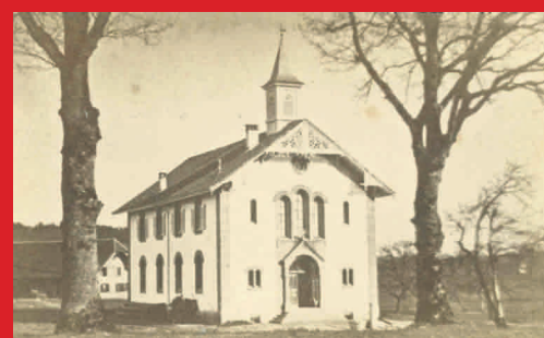
Die Kirche Cordast, wie sie sich kurz nach der Einweihung 1875 präsentierte.

Nachdem die reformierten Schulen Gurmels und Courtepin gegründet worden waren (1855/1860), fand in deren Schulstuben monatlich ein Gottesdienst statt. Aber für Taufen, Hochzeiten oder Beerdigungen war dies keine Lösung. Hierfür musste man den weiten Weg in eine benachbarte Kirche auf sich nehmen. Eine eigene ref. Kirche im weitläufigen oberen (kath.) Seebezirk wäre eine grosse Erleichterung – aber wo?