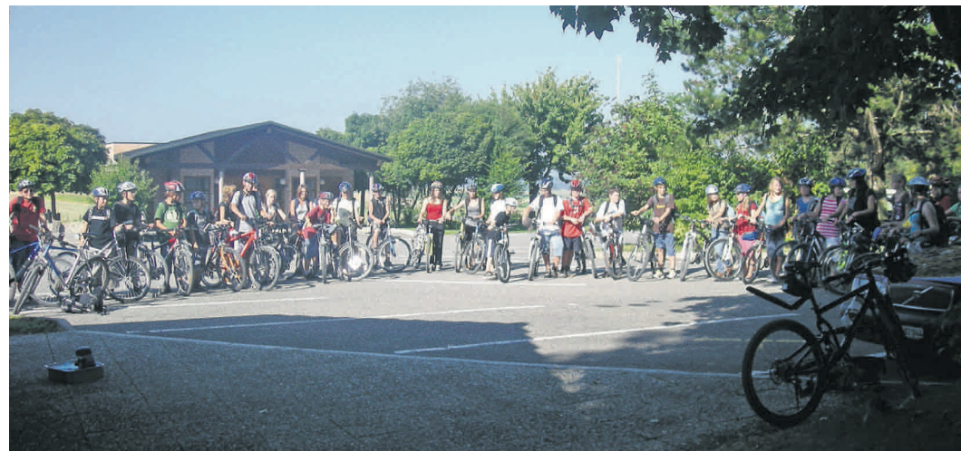
Jahr für Jahr führte eine Velotour die neuen OS-Schüler:innen auf die geschichtlichen Spuren der Kirchgemeinde. Oft wurde auch beim ehemaligen reformierten Schulhaus in Courtepin Halt gemacht, in dem sich heute die Ludothek befindet.

Hermann Schöpfer: Les monuments d'Art et d'Histoire du Canton de Fribourg (Tome IV. Le district du Lac I), Basel 1989.