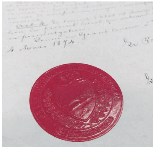
Am 4. März hat der Grosse Rat das Dekret zur Gründung der Kirchgemeinde Cordast einstimmig verabschiedet. Das handschriftliche Original mit Staatssiegel wird heute im Staatsarchiv in Freiburg aufbewahrt.

Erste reformierte Familien wanderten Anfang des 19. Jahrhunderts ins katholische Freiburgerland. Damals hatte Napoleon auch in der Schweiz einiges umgestaltet: Die ehemaligen Untertanengebiete wurden zu eigenständigen Kantonen; so etwa das Waadtland oder der Aargau. Zudem wurde die Glaubens- und Gewissensfreiheit eingeführt. Vorher galt: in den katholischen Kantonen ist man katholisch / in den reformierten Kantonen sind alle reformiert. Die ersten Berner Einwanderer sind 1825 registriert. Nach den Turbulenzen des Sonderbundkriegs und der ersten Bundesverfassung 1848 mit der verbrieften Niederlassungsfreiheit werden sie immer zahlreicher, vor allem im landwirtschaftlichen Bereich als Bauern, Käser, Schmied, Wagner oder Müller.